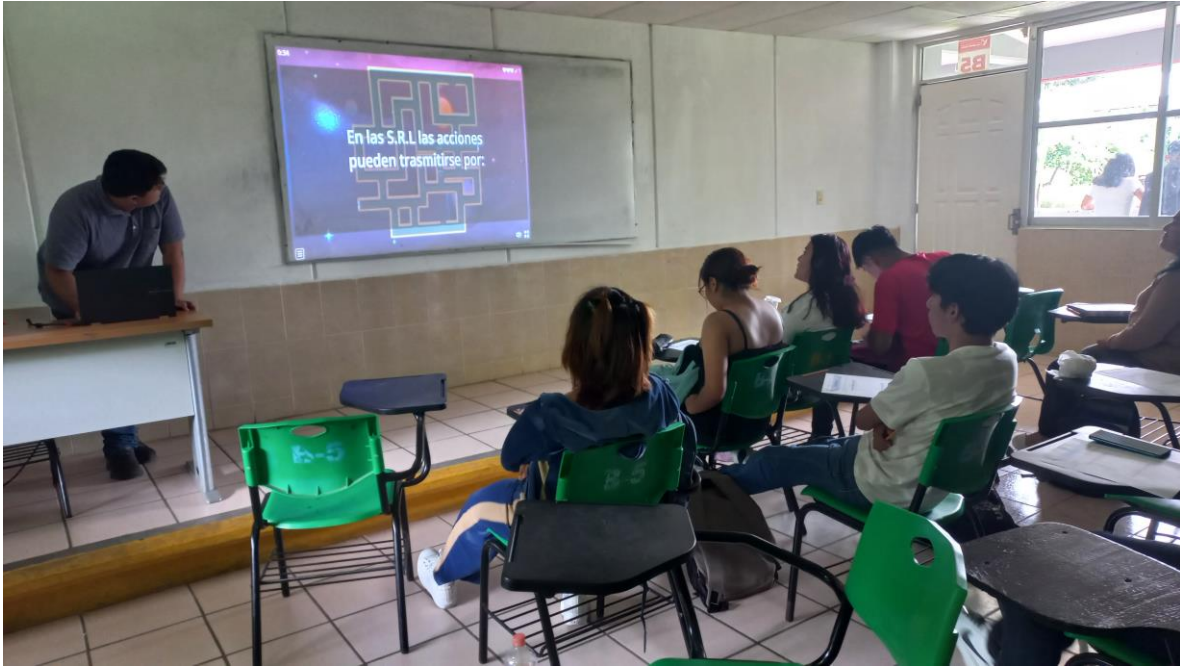
ACT. EN CLASE - UII